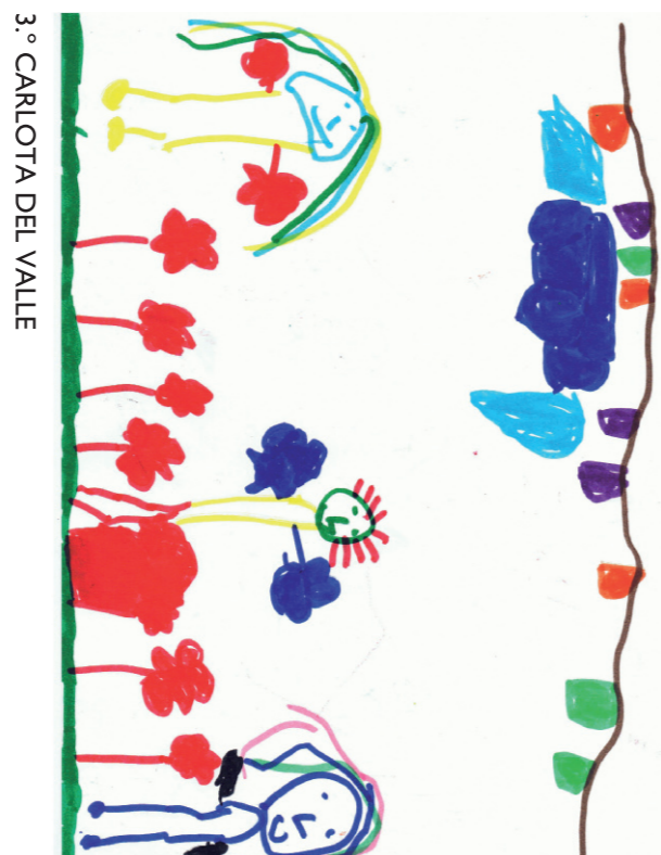
3.º CARLOTA DEL VALLE