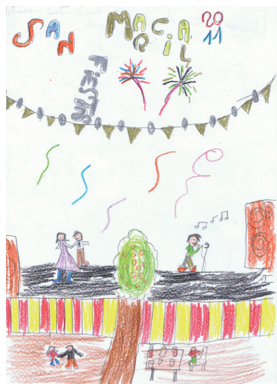
2.º FITIAVANA GASTAN